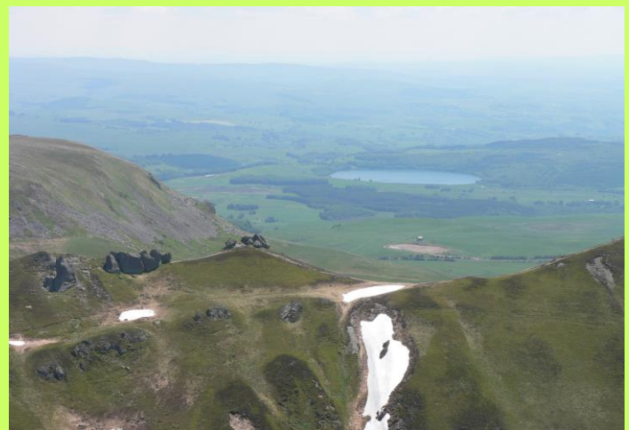
Le lac Pavin, + jeune volcan d'Auvergne 7000 ans, vue du jour 2