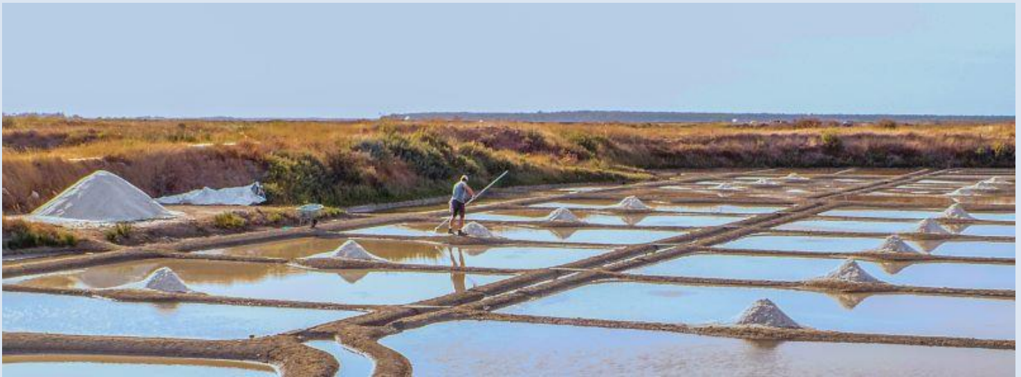
Les marais salants de Guérande et ses environs, encore bien actifs

Temps de marche : 3 à 4 h. Dénivelé : 100 + . Distance 10 à 12 km