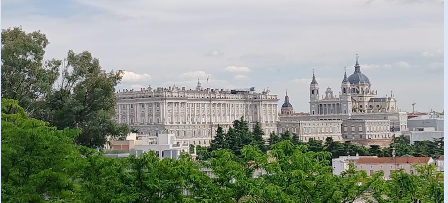
Le palais royal et la cathédrale

Mais Madrid, vit aussi la nuit et les rues sont très animées le week end, notre hôtel est idéalement situé pour cela, repas de tapas