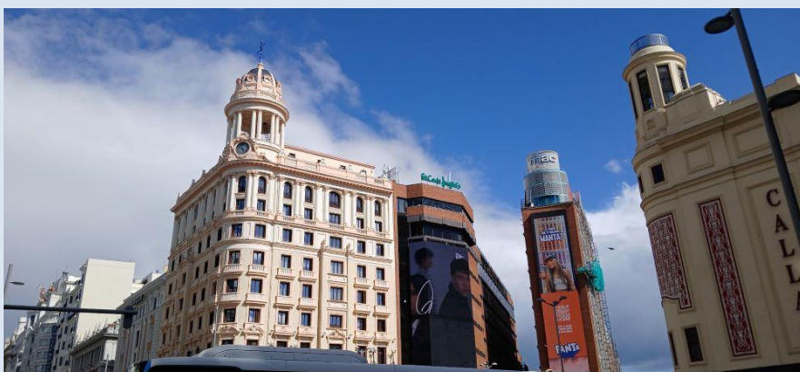
La Gran Vía avec ses beaux immeubles Art Déco - Art Nouvea