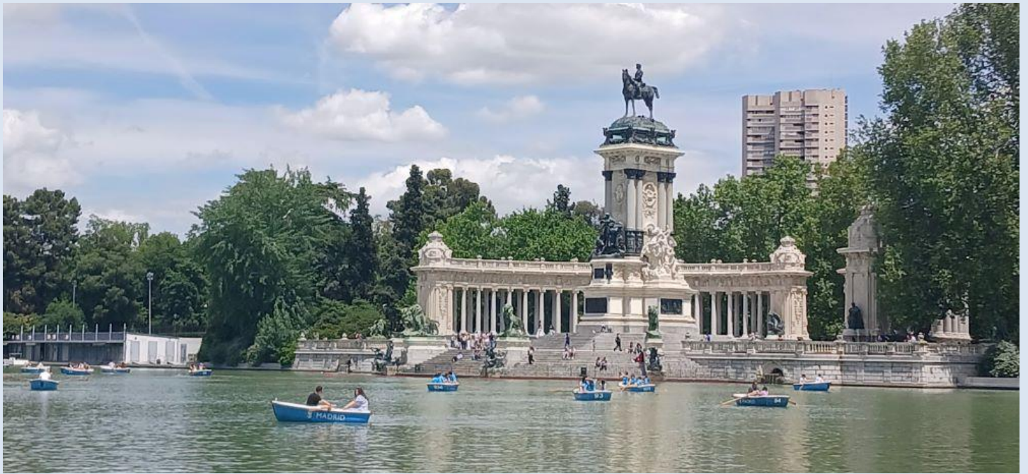
Le retiro : 125 hectares de jardins avec lac, roseraie, palais de Crystal & paons en liberté