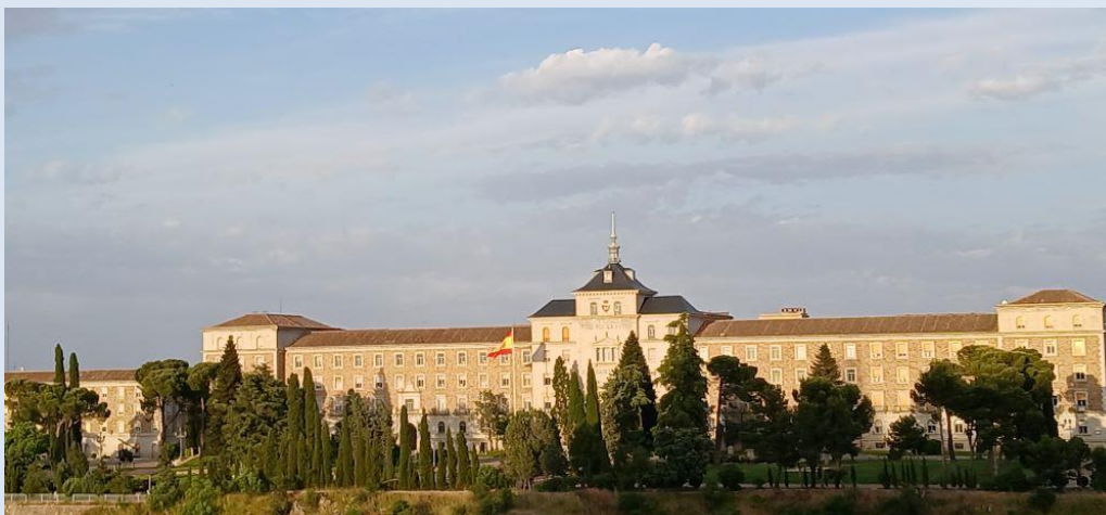
Musée de l'Alcazar et cathédrale de Tolède